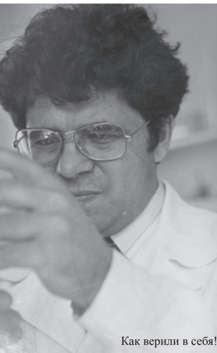
Как верили в себя!