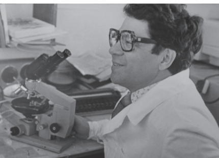
...ды мы были...