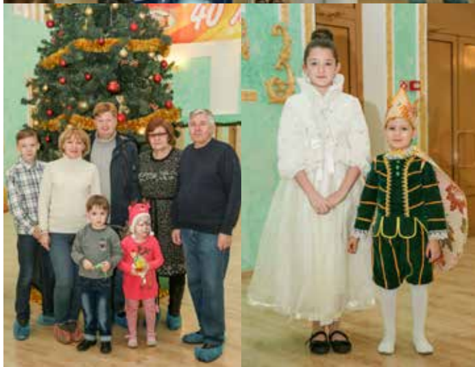
На новогоднем детском празднике.